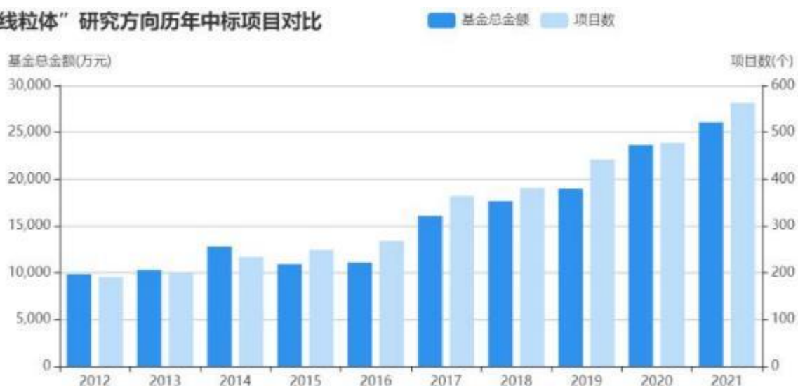
“线粒体”研究方向历年中标项目对比

最重要的是，线粒体还可以通过多种机制控制细胞死亡的方式，特别是调节性细胞死亡（RCD），如细胞凋亡（apoptosis）、NETosis、细胞焦亡（pyroptosis）、坏死性凋亡（necroptosis）等。